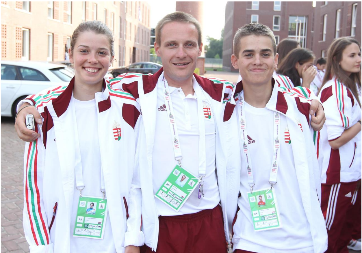
A Kerékpár Csapat