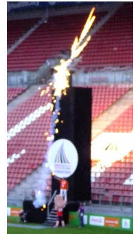
Az olimpiai láng meggyújtása

Az egész esemény az igazi olimpia „kicsinyített” mása, annak minden ceremóniájával együtt. Volt itthon eskütétel, kint megnyitó ünnepély olimpiai lánggyújtással, és záróünnepély. Az eskütétel már jelezte az esemény rangját. A megnyitó ünnepségen a csapat bevonulása volt a csúcspont. Ekkor lehetett a legjobban érezni, hogy mekkora az EYOF rangja. Viszont a megnyitó ünnepély szerintem egy kicsit szerényre sikerült. Sok beszéd, kevés műsor, és ismeretlen előadók. Az olimpiai láng behozatala, holland olimpiai bajnokokkal megint színvonalas volt. Az olimpiai láng meggyújtásának is egy érdekes és új módját láttuk. A záróünnepet átköltöztették a stadionból az általunk csak alakuló térnek becézett helyre, az olimpiai faluba. Itt egy kicsit kevés volt a hely ennyi embernek, és a műsor sem volt nagy szám. A végén a DJ jó hangulatot csinált, és a gyerekek felszabadultan szórakoztak.