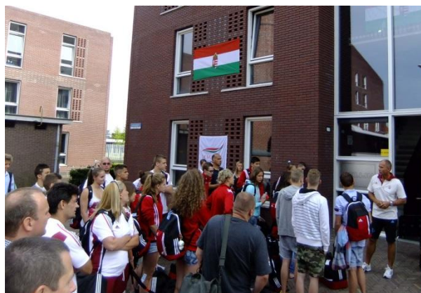
.A fogadóbizottság már felkészült. A szállásnál minden gördülékenyen ment

Itt már látszott egy kis fejetlenség, de innen már minden simán ment. A küldöttség első tagjai mindent előkészítettek. Megkaptuk az akkreditációs kártyákat, és a szobakulcsokat, és némi eligazítást. Elfoglaltuk a szobákat. Mi a földszinten kaptunk szobát. Itt a szobákban egy asztal, két ágy, és egy mosdó volt. Az ágyak nem voltak valami kényelmesek, inkább pótágyak voltak. A földszinti szobákhoz 2-2 közös tusoló és WC tartozott. Innentől