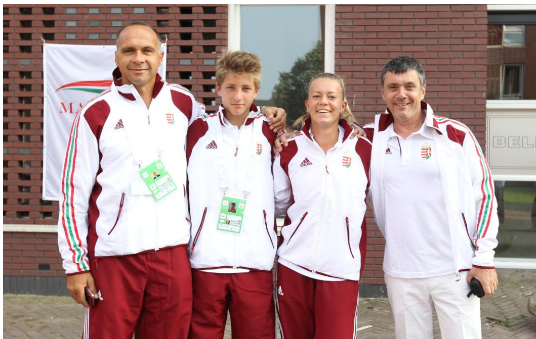
A Tenisz Csapat – erősítésessel ©