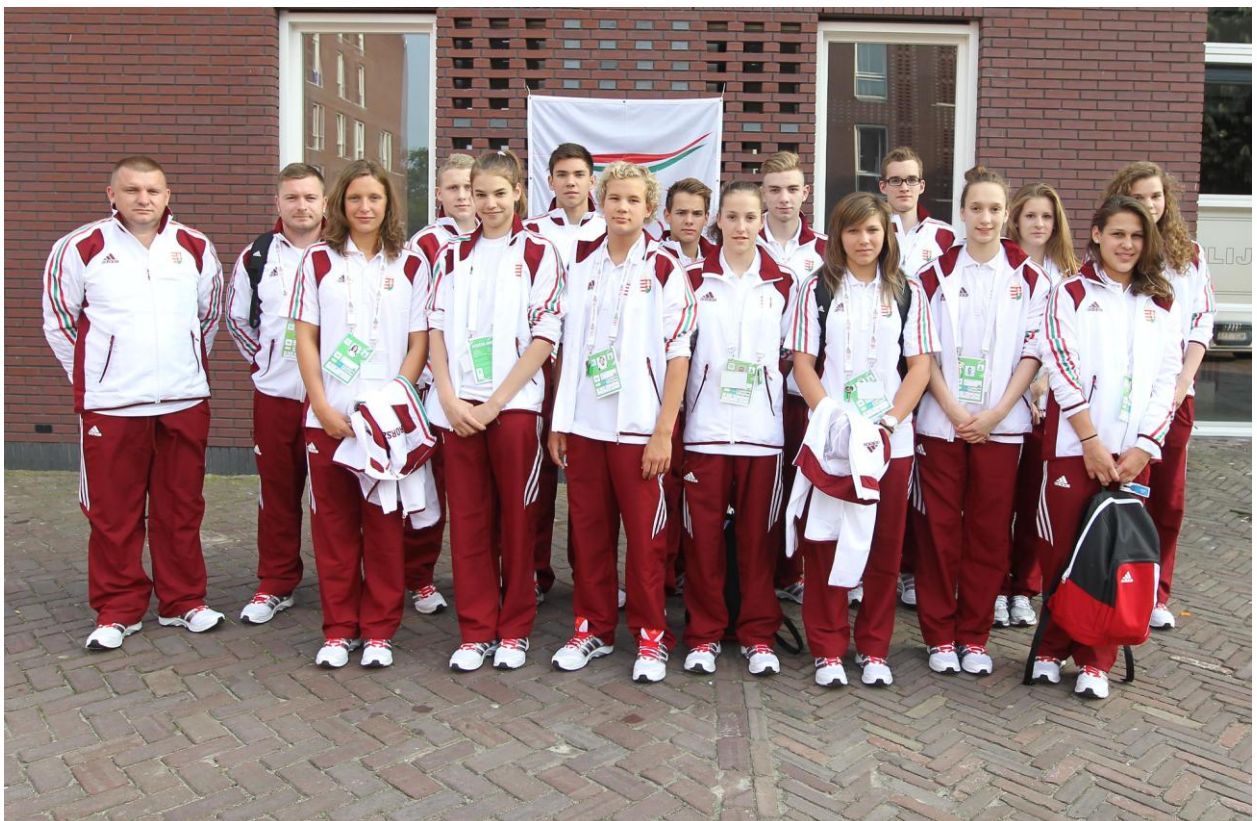
Az Úszó Csapat