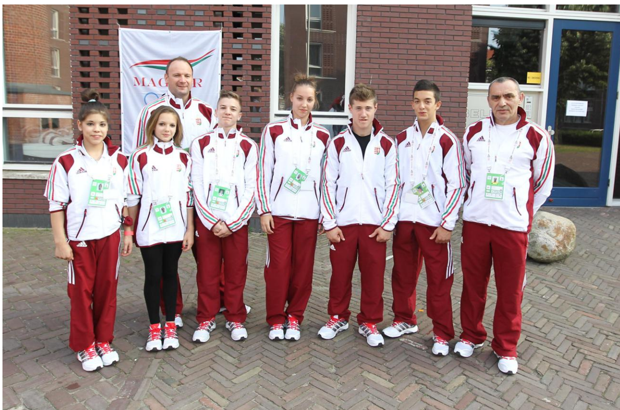
A Torna Csapat