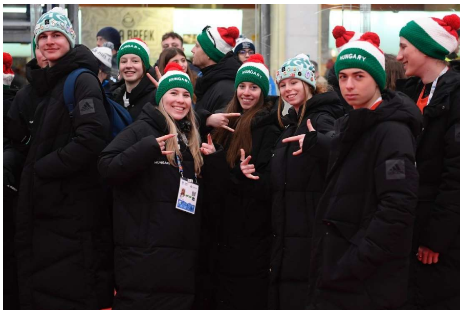
Sportolóink felszabadultan a záróünnepségen

A szállások sokszor igen távol voltak a versenyhelyszíntől, a rövidpályás gyorskorcsolya- és műkorcsolyacsapat naponta 2 x 50 percet utazott. Szerencsére MOB gépjárművekkel meg tudtuk oldani az ideális transzfert, a szervezők által biztosított transzfer ritkán és optimálisnak nem mondható időszakokban indult.