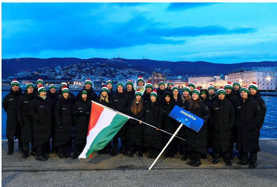
A teljes Magyar Csapat a téli EYOF megnyitóünnepségén

A 21 fős utazó csapatból tizenöten Budapesten, öten vidéken és 1 fő külföldön, határon túli magyarként született. Aktuális lakhelyük szerint a 21 főből 15 Budapesten vagy a fővárosi agglomerációban él, 1 fő Erdélyben. Sportszervezeteket tekintve a 3 vidékin kívül mindenki budapesti vagy főváros környéki klubhoz tartozik. Bár itt érdemes megemlíteni, hogy többen Magyarországon kívüli sportgimnáziumba járnak és hónapokig életvitel-szerűen külföldön tartózkodnak, ami tovább bonyolítja a helyzetet.