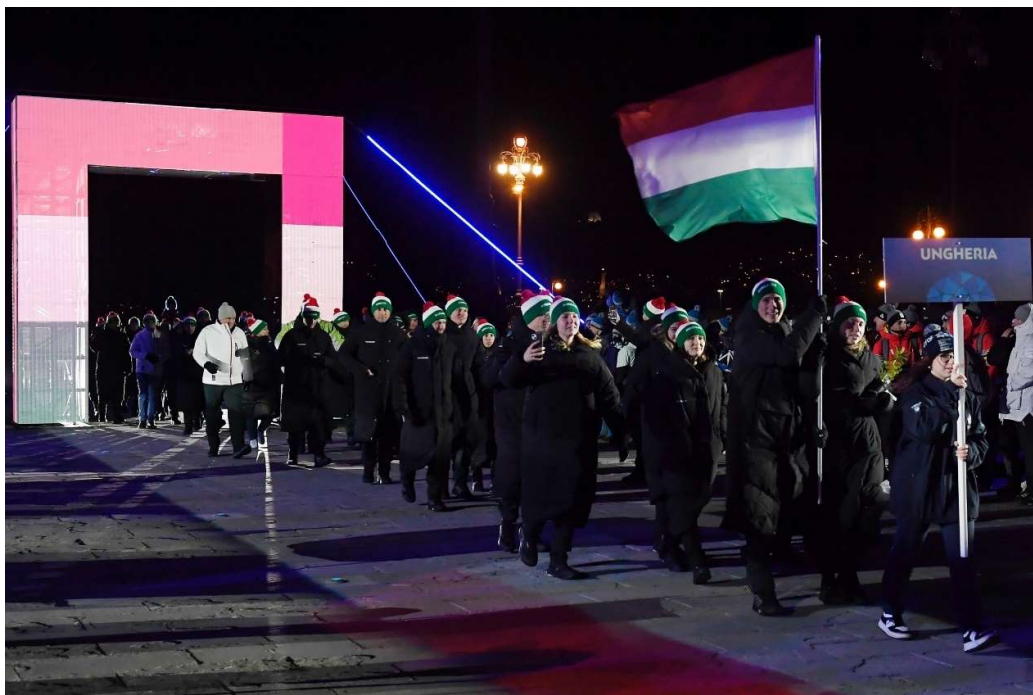
A Magyar Csapat bevonulása

A csodálatos természeti adottságokkal rendelkező térség ugyan sportszakmai szempontból kiváló választásnak bizonyult, azonban a klasszikus sportolói falu hiánya és a nagy távolságok rendkívül megnehezítették a szervezést és logisztikát. Mind a Szervezőbizottság, mind az Olasz Olimpiai Bizottság (CONI) úgy tekintett erre a téli EYOF-ra, mint a 2026-os Milánó-Cortina-i felnőtt téli olimpia főpróbájára, hiszen 3 év múlva a mostanihoz hasonlóan több, szám szerint 7 faluban szállásolják majd el a delegációk tagjait – egymástól több száz kilométerre.