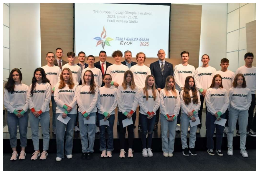
Az ünnepélyes fogadalomtétel

Mivel számunkra nem csupán az érmesek voltak fontosak, hanem minden magyar résztvevő, igyekeztünk minden sportágról, érmesről – a szöveges tartalmak mellett – fotókat és videókat készíteni. Ez az események, döntők egyidejűsége miatt sokszor nehézségekbe ütközött; de készült 8 000 fotó, amelyekből összesen 16 képgalériát tettünk közzé a honlapon és a közösségi médiában. A fesztivál előtti ruhaátadáson a teljes magyar delegáció portréfotózása megtörtént, ami az egységes csapatkönyvi megjelenés mellett az archívumunkat is gyarapította.