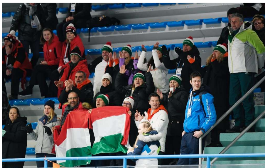
A magyaroktól volt hangos a pontebbai jégcsarnok

Összeségében elmondható, hogy az előkészületek során meghatározott csapattirodai és egészségügyi felállás jól működött az esemény alatt, a felmerülő problémákat minden esetben azonnal tudtuk orvosolni.