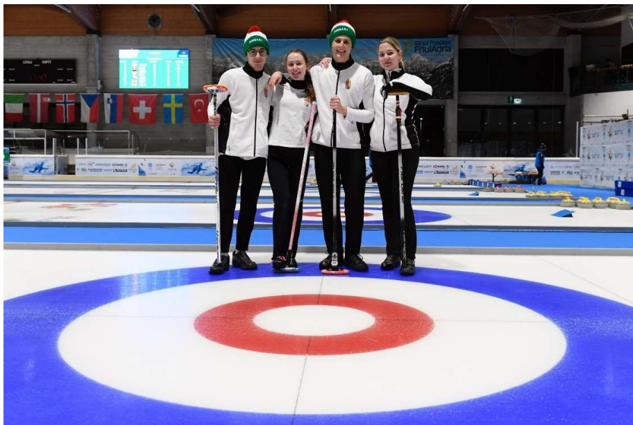
A téli EYOF-on részt vevő curling vegyes csapat.