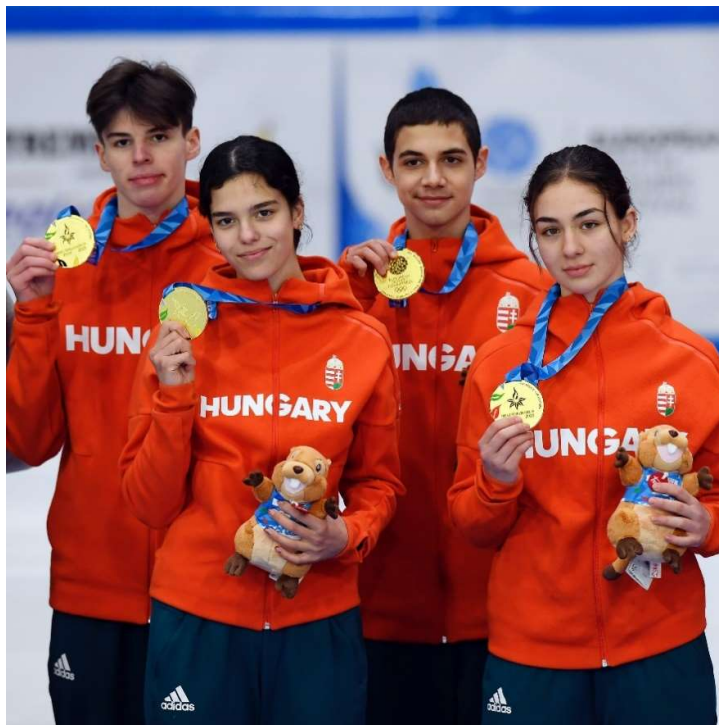
Minden magyar rp. gyorskorcsolyázó aranyéremmel térhetett haza

biztosított transzferekre támaszkodtunk volna, az közvetlenül is érinthette volna a sportolók pihenését és sportteljesítményét.