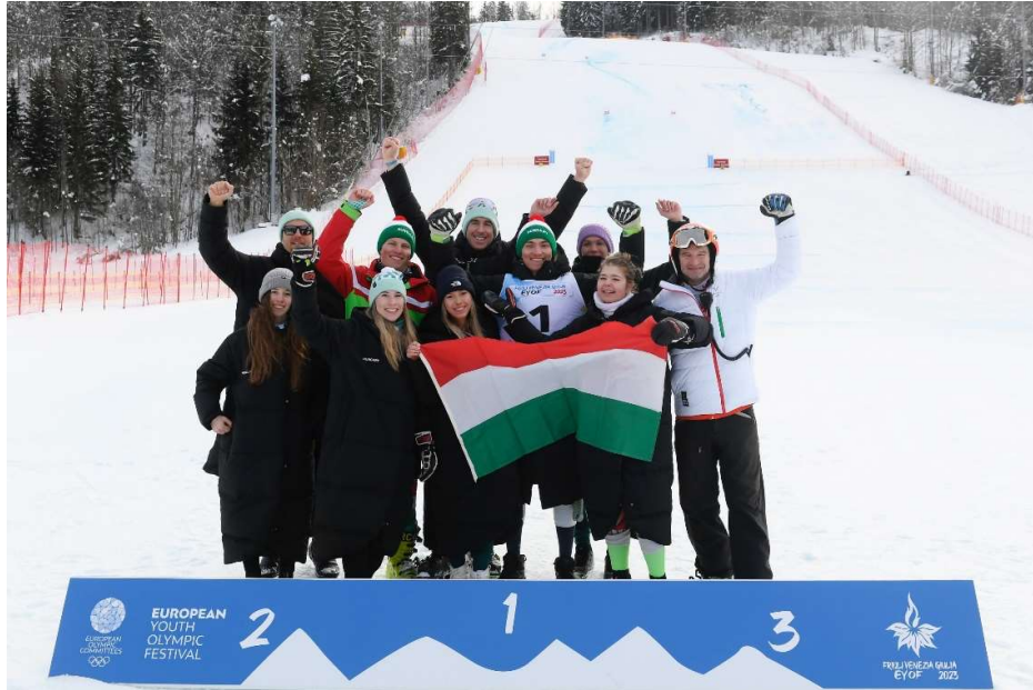
Az alpesi sí csapat a történelmi siker után