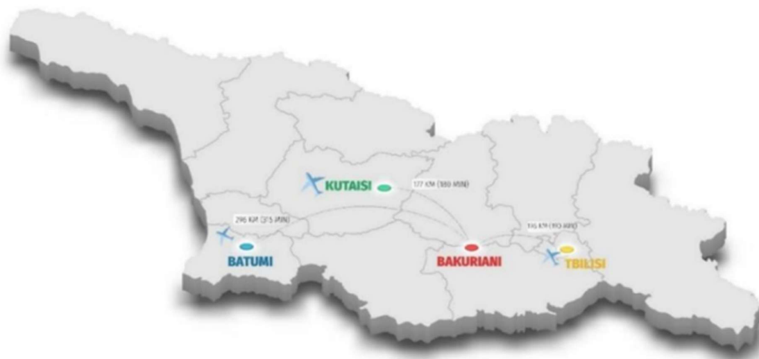
Georgia három városa, Bakuriani, Batumi és Tbiliszi adott otthont a 2025-ös téli EYOF versenyeknek.

1993-tól az európai olimpiai mozgalom legfontosabb téli utánpótlás-eseménye az Európai Ifjúsági Olimpiai Fesztivál (EYOF), amelyen Magyarország a Magyar Olimpiai Bizottság (MOB) szervezésében néhány kivétellel, szinte minden alkalommal részt vett. A multisportesemény a 2015-ös nyári EYOF után érkezett ismét Georgiába, de most a téli verzióval, amelynek Georgia három városa adott otthont. Bakurianiban rendezték meg a havas, Batumiban a jeges sportágak küzdelmeit, a jégkorong-torna pedig Tbilisziben kapott helyett. A nagy távolságok miatt három falu szolgálta ki a sportolókat és szakembereket, akiket szállodákban és apartmanokban helyeztek el. Kutaisi repülőtérétől Batumi 2 órás, Bakuriani 3 órás autóútra fekszik. Tbilisziből szintén körülbelül 3 órányi távolságra található Bakuriani. Nyitóünnepséget és záróünnepséget csak a havas helyszínek központjában, Bakurianiban rendeztek, amelyet a két másik városban lévő delegáció tagjai online követhettek. A beszámolón belül a sportprogramot összesítő táblázatban láthatóak a helyszínek és a szakágak eloszlásai.