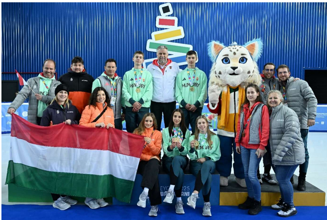
A MOB vezetése és csapattirodai munkatársai mindkét helyszínen jelen voltak az esemény teljes időtartama alatt.

A repülőgépes utazással és az EU-n kívüli helyszínnel összefüggésben a biatlonos fegyver-, és lőszerszállítás kapcsán néhány adminisztratív akadályt leszámítva zökkenőmentes volt az út.