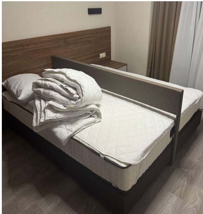
Elválasztó paraván a Bakuriani sportolói faluban.