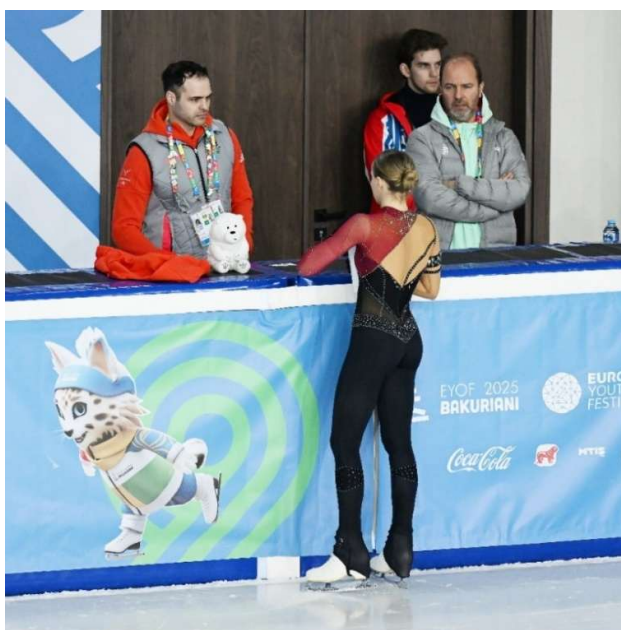
Mindkét érintett városban jelen volt a Magyar Csapat egészségügyi stábja.

Az előre egyeztetett összetétel és mennyiségi adatokkal részletezett megrendelés alapján az Országos Sportegészségügyi Intézet gyógyszertára állította össze a gyógyszerkészletet. A vám és beviteli engedélyek nem okoztak nehézséget. Határidőre konkrét gyógyszernév-hatóanyag-darabszámot is tartalmazó listát kellett készítenünk. A lista elkészítését és engedélyeztetését követően még bővült a sportolói létszám, így nagyobb szerepet kapott az előzetes tartalékképzés. A gyógyszerpiac folyamatosan változik, bizonyos termékek ebben az időszakban is megszűntek, ezeket azonos hatóanyaggal pótoltuk. Fizioterápiás készülékeket is a MOB raktárkészletéből vittünk (masszázsasztal, Tens készülék)