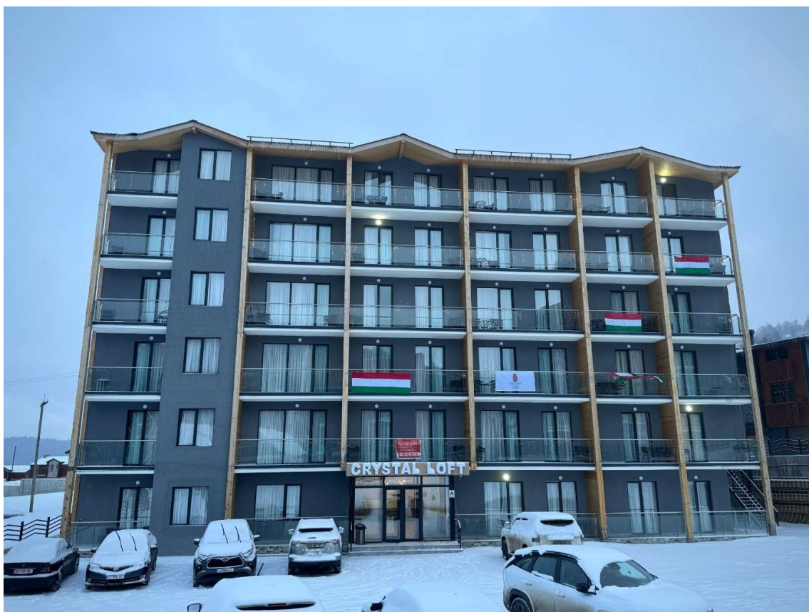
A Magyar Csapat szálláshelye a Bakuriani sportolói faluban