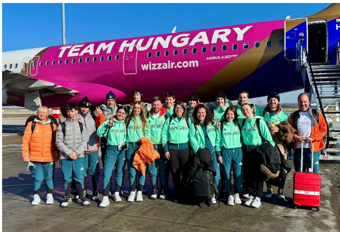
A Magyar Csapat a MOB partnerével, a Wizz Air légitársaság menetrendszerinti járataival utazott az eseményre.

Ahogy a korábbi ifjúsági multisporteseményeknél, úgy ezúttal is ragaszkodtunk a közös ki-, illetve hazautazáshoz, azonban több sportoló esetében sportszakmai indokokat figyelembe véve engedélyt adtunk a külön utazásra.