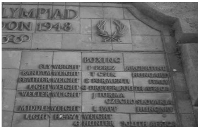
Csik Tibor győzelmét is hirdeti az 1948-as londoni olimpia bajnokainak emléktáblája a Wembley Stadion előterében.

Csik a Budapest-Vidék (11:5) válogatott mérkőzésen Kovács Istvánt győzte le kiütéssel.